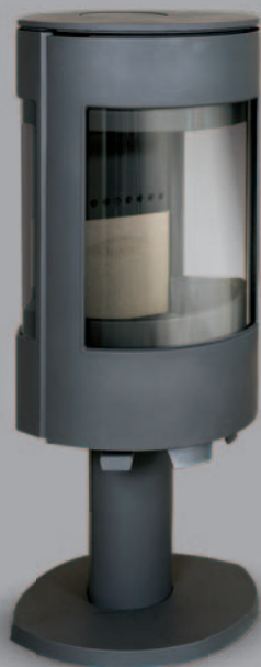
dovre | ASTRO 3 CB/P